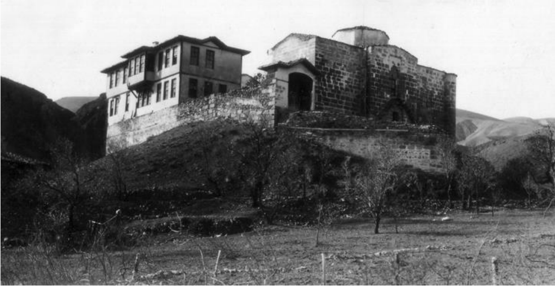
Fotoğraf 2. Mevlevihane Şeyh Evi (Alman K lt r Merkezi Arşivi D-DAI-IST-KB 26.917).