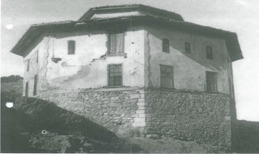
Fotoğraf 4. Semahane (Üçok, 1941, s. 122).