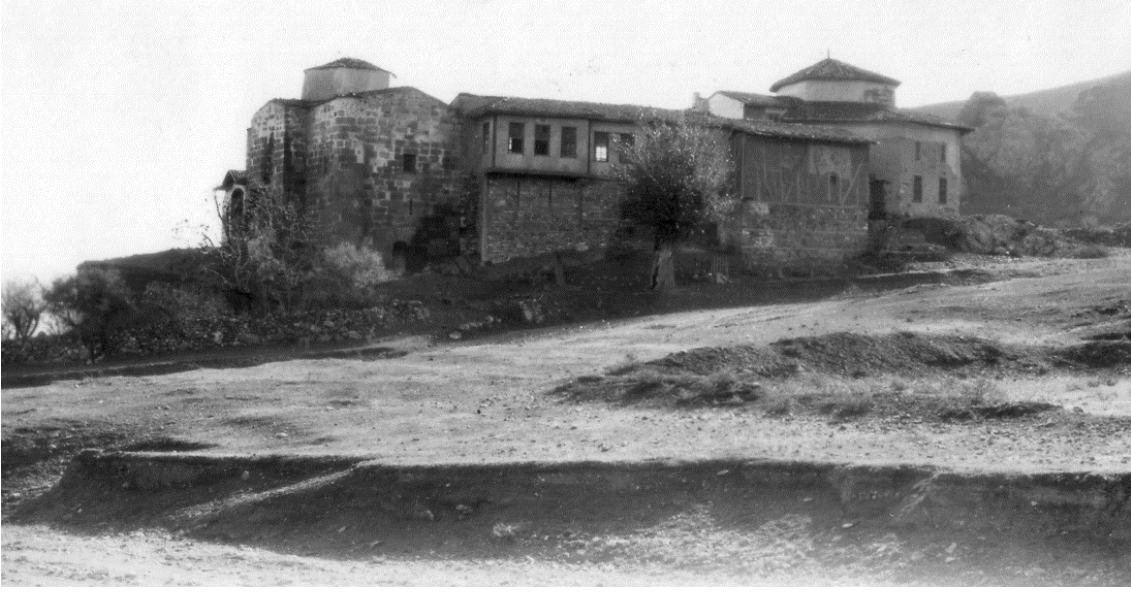
Fotoğraf 3. Mevlevihanenin kuzey-batıdan görünüşü.